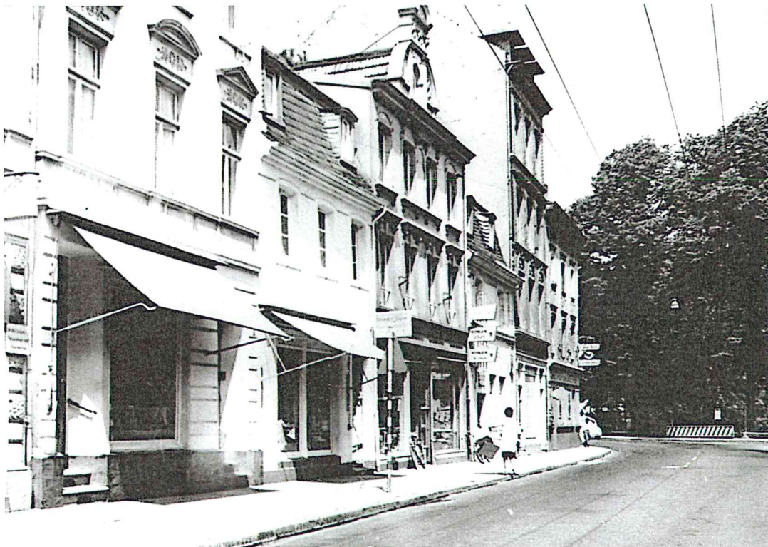
Geschäftszeile in der vorderen Clemens-August-Straße (Nr. 12 - 2) vor deren Erweiterung