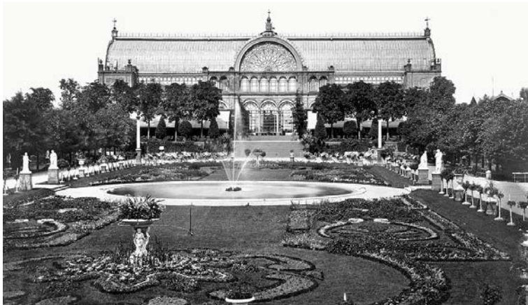
Foto von 1880, also 15 Jahre nach der feierlichen Eröffnung des vom General-Gartendirektor P. J. Lenné entworfenen Botanischen Gartens sowie des vom Architekten Max Nohl geschaffenen Wintergarten-Palasts aus Eisen und Glas.

Seit 2008 beherbergt der Park zudem die erste Palmenallee Deutschlands. Das Flora-Ensemble von Peter Joseph Lenné von 1864 und der Botanische Lehrgarten von 1914 sind seit 1920 vereinigt und stellen nun eine einmalige Verbindung eines Gartendenkmals und eines Botanischen Gartens mit Pflanzenschauhäusern dar.“